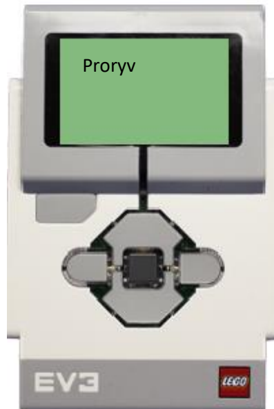
Рисунок 2. Пример вывода информации