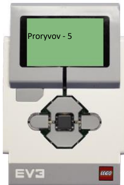
Рисунок 3. Пример вывода информации по окончании работы робота