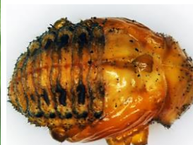
Куколка колорадского жука