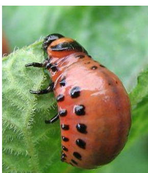
Личинка колорадского жука