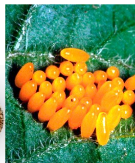
Яйца колорадского жука