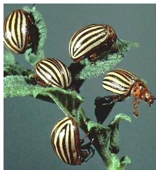
Взрослые особи колорадского жука

1. Рассмотрите фотографии. Сколько живых организмов и сколько видов на них изображено?